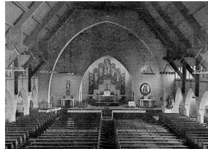
RK Onze Lieve Vrouw van Goede Raadkerk te Beverwijk die de oudste muurschildering ter wereld bevat van de Vrouwe van alle Volkeren.