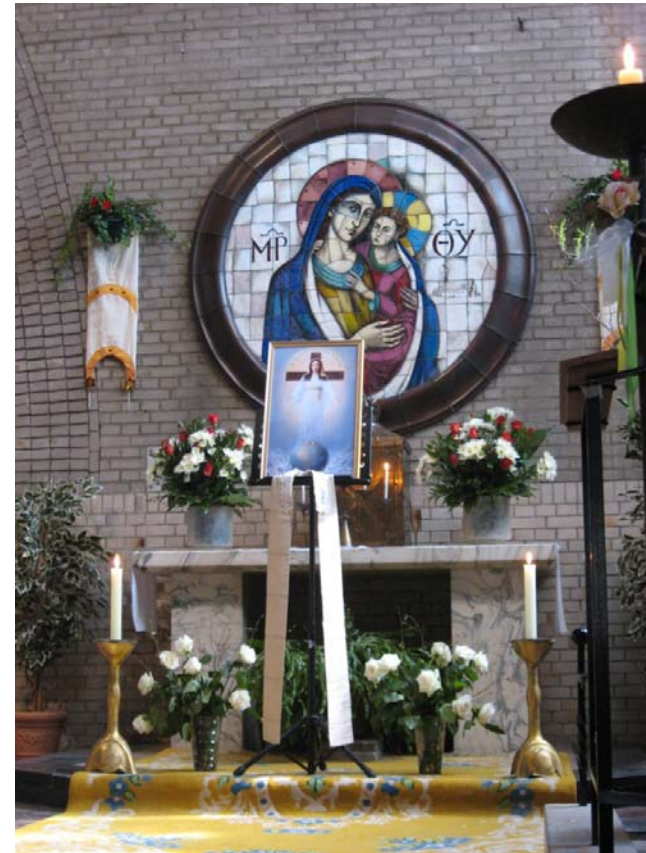
Intronisatie van de huidige afbeelding van de Vrouwe op 8 december 2008 in de O.L.V. van Goede Raadkerk.

Moet ook deze kerk verloren gaan voor de verering van de Vrouwe van alle Volkeren?